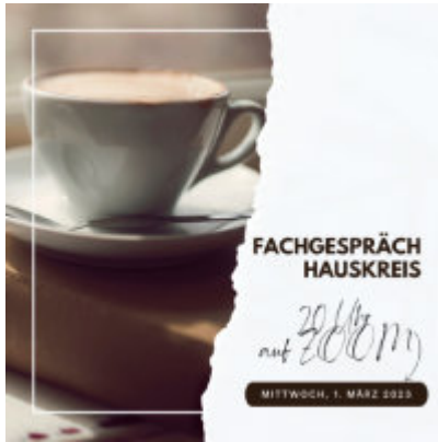
Quelle: Fachgespräch Hauskreis