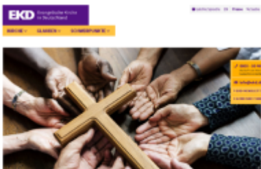
Materialien Gottesdienst und Migration

Die Arbeitsgruppe „Gottesdienst und Migration“ der Liturgischen Konferenz hat ihre Homepage deutlich erweitert und aktualisiert. Dort finden sich Predigten und liturgische Texte zu „Flucht“ und „Migration“, mehrsprachiges Material und viele Impulse für die interkulturelle Gemeindepraxis. Sie bietet sich für die Interkulturelle Woche vom 23. bis 29. September 2018 und zahlreiche anderen Anlässe im Kirchenjahr an.