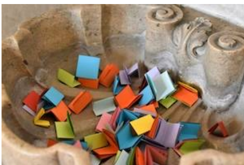
Papier im Kirchenalltag